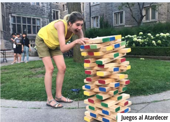
Juegos al Atardecer

El Trinity College de la Universidad de Toronto no está afiliado al programa de verano CISS